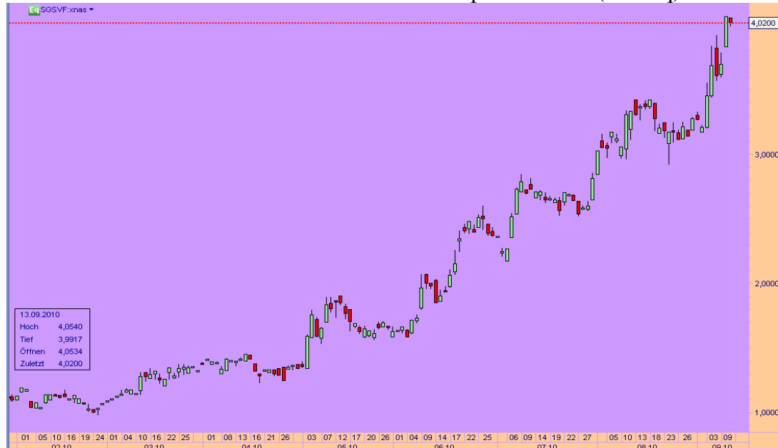
Grafik 2: Sabina Gold & Silver von Februar bis September 2010(Nasdaq)

Die aktuellen Stars des Minensektors tragen edle Namen (First Majestic, Great Panther Silver usw....) Bis vor kurzem noch relativ unbekannt, steigen sie seit ein paar Monaten wie Phönixe aus der Asche. Als eine Art Microsoft der Junior Miner präsentiert sich momentan beispielsweise Sabina Gold & Silver. Grafik 2 zeigt den Kursverlauf dieser Minenaktie während der letzten 7 Monate, in denen sie vervierfachte.